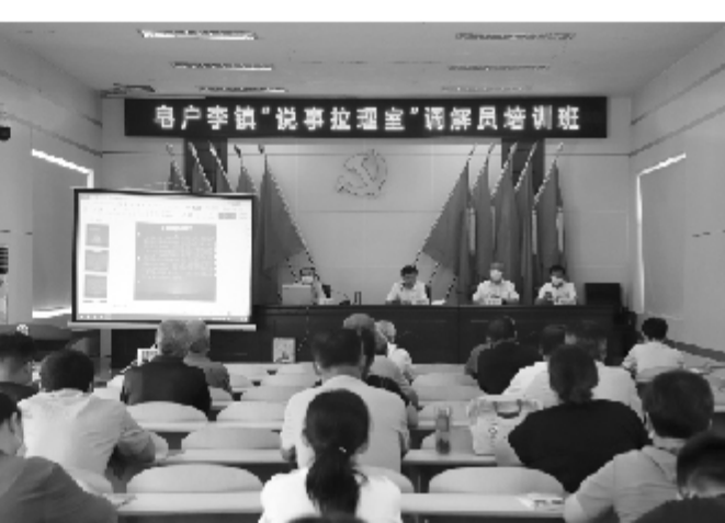
皂户李镇调解员接受培训

石庙讯 “喂，您好，我们是石庙镇疫情联防联控工作小组，请您接听电话，为进一步加强流调排查力度，石庙镇成立了疫情流调及电话随访专班，共30名镇青年志愿者们加入电话流调排查工作中。截至目前，该专班累计排查3500余人次。 石庙镇负责人表示，将进一步扩大志愿者队伍，在服务群众、奉献社会中增强工作本领，提升思想境界，展现青年人的责任担当。 (记者 董梦璐 通讯员 张双燕 郭瑞瑞 张松正 王震)