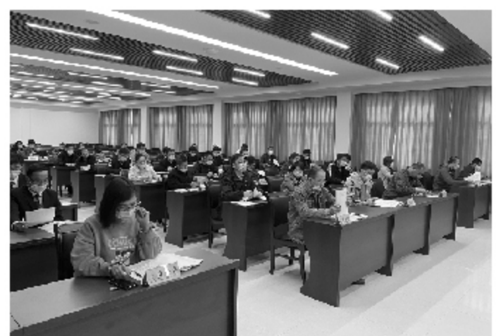
安全培训 未雨绸缪

□本报记者 梦璐 元元 通讯员 冬冬 报道 本报讯 为统筹做好优化营商环境和疫情防控工作，县行政审批服务局全面梳理现场勘查环节中费时费力的堵点、难点及痛点问题，针对问题特设审批流程，多措并举，全力做好现场勘查工作，做好服务群众最后一公里。 该局工作人员在收到受理申请后主动介入，通过电话、微信等通讯方式，对申请人（单位）的前期筹备准备工作进行指导，并定期对事项筹建进程进行跟踪，对符合条件的申请事项开展实时勘查。在做好实时勘查的基础上，工作人员