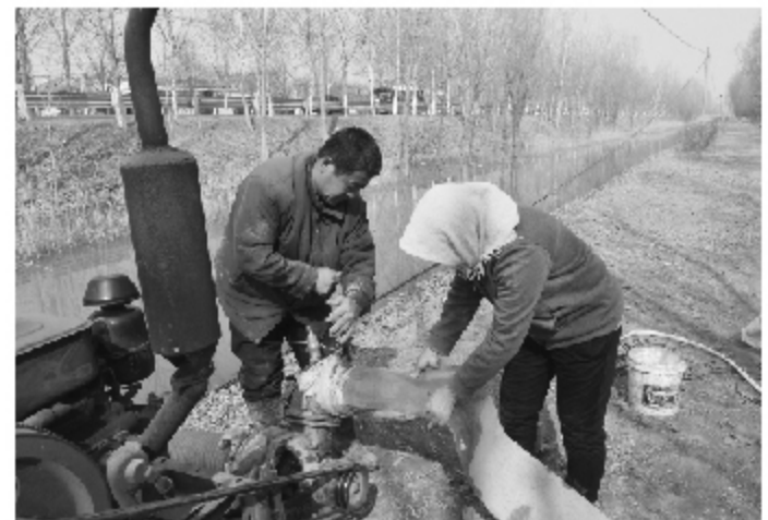
李庄镇：优化配置水资源

□本报记者 董梦璐 通讯员 李峰 李峰 报道 3月29日，惠民经济开发区举办《山东省生产安全事故应急预案编制导则》及通则专题培训，54家企业参加培训。 培训会解读了《山东省生产安全事故应急预案编制导则》和《生产运营单位生产安全事故应急预案编制导则》，详细介绍了企业生产安全事故应急工作要点。