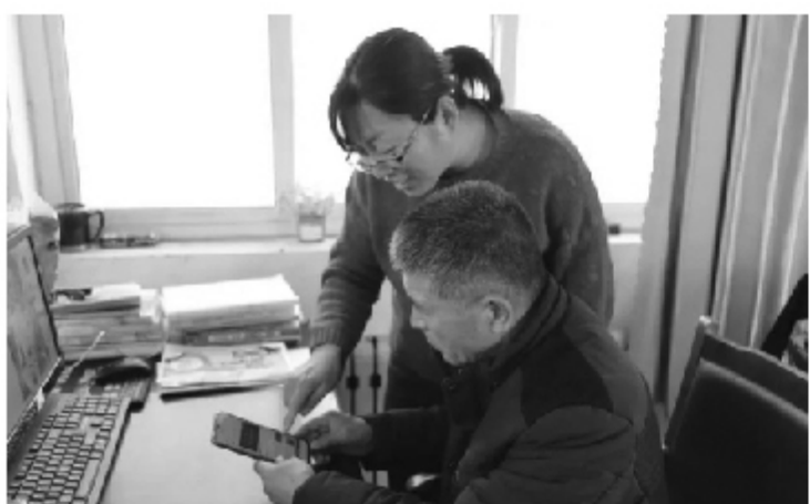
开好局、起好步，为推动大年陈教育高质量发展贡献自己的力量！”

把本部门打造为集中学习的最小组织堡垒，切实增强学习宣传贯彻党的十九届五中全会精神的针对性、时效性，推动全会精神在基层落地生根。 示范引领，发挥带动作用 大年陈学区充分发挥青年党员、骨干教师的示范带头作用，营造浓厚的学习氛围，广泛开展示范引领带动学和自学相结合的模式。在各个教学点中，青年党员带动老党员，骨干教师带动普通教师，大家利用课余时间，通过手机短视频、“学习强国”App等方式随时随地学习全会精神，并把全会精神融入平时的教学当中，把学习贯彻党的十九届五中全会精神推向高潮。 学区老师们纷纷表示：“党的十九届五中全会精神反映了人民的心声，催人振奋，备受鼓舞，作为新时代的教师，要有时不我待的情怀，勇往直前的精神，以强烈的使命感和责任感，为学校‘十四五’发展谋好篇、