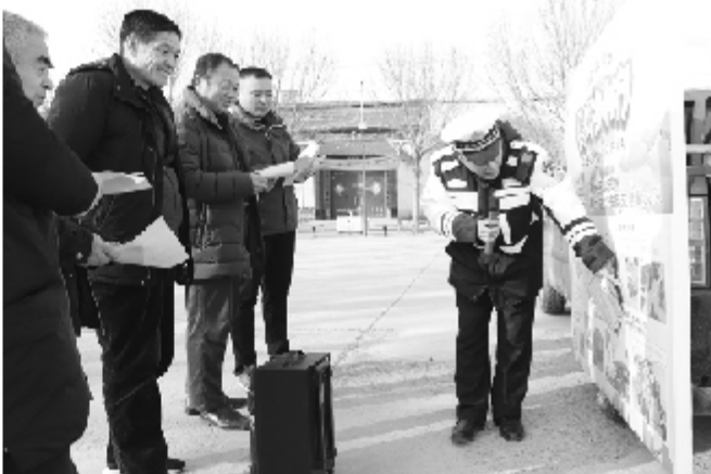
乡村行 安全行 □通讯员 报道 12月21日，县公安局交警大队民警深入辖区农村开展“美丽乡村行”交通安全宣传。活动中，民警以通俗易懂的图板形式向村民展示《畅行

□本报记者 郑海涛 通讯员 郑文超 张亚琳 报道 辛店讯 “年纪大了，腿脚又不方便，村里通知要采集养老待遇指纹，要是我自己到人社所去的活来回要花上半天，现在社区干部统一组织我们到社区、村办公室采集，给我们带来了许多便利。”辛店镇大车社区张大爷说道。近日，辛店镇开展老年人养老待遇指纹采集工作。辛店镇在各个社区、村办公场所设立了指纹采集点，并组织专人为辖区内高龄和行动不便的老人进行上门服务。 为确保养老保险指纹资格认证工作不漏登、不错登，辛店镇各社区安排社区工作人员携带电脑、摄像头和指纹录入仪等设备进村入户进行采集指纹认证工作，让更多享受养老待遇的老人在家就可以完成指纹认证，受到群众的一致好评。 辛店镇辖9个社区和120个村，全镇共计5万余人，60岁以上的老人10400余人，目前指纹采集工作已经完成80%。接下来，辛店镇将继续采取上门服务等方式，确保全镇老年人口指纹采集不漏一人。