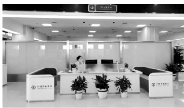
便捷、高效的政务服务体系，不断优化全县营商环境作出新的更大贡献。

网点环境优美、功能齐全、工作人员业务精湛、服务热情周到，得到了前来办事企业及群众的一致好评。下一步，惠民农行南关分理处将继续致力于做百姓身边的银行，常抓优质服务，以服务质量提升，坚持“一言一行树农行形象，一心一意为客户服务”的经营理念，持续创新金融服务方式，更好地为群众和企业提供专业、规范、方便的服务，促进我县营商环境再优化。 今后，县行政审批服务局将继续以“只进一扇门，办好所有事”为目标，不断加强“一站式”服务理念，为全力构建便捷、高效的政务服务体系，不断优化全县营商环境作出新的更大贡献。