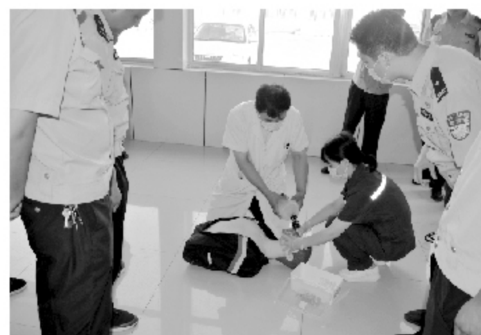
应急救援演练“动真格”

爱心团商公司研发了捐赠证书和爱心牌匾，并对两家企业情系工会、关心职工的爱心善举表示感谢。 据悉，此次爱心捐赠的价值5万元的营养食品将全部用于全县职工“送温暖”、“送清凉”活动中。