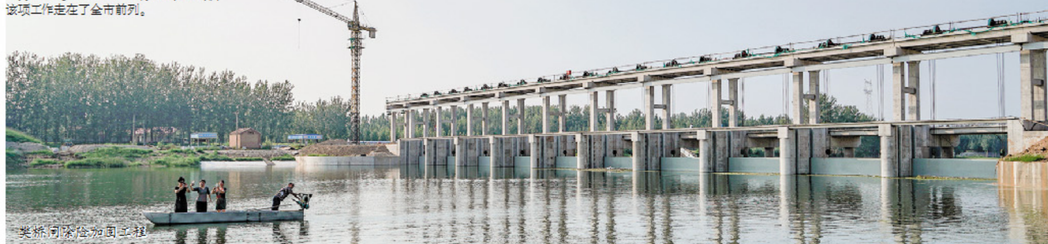
樊桥闸除险加固工程