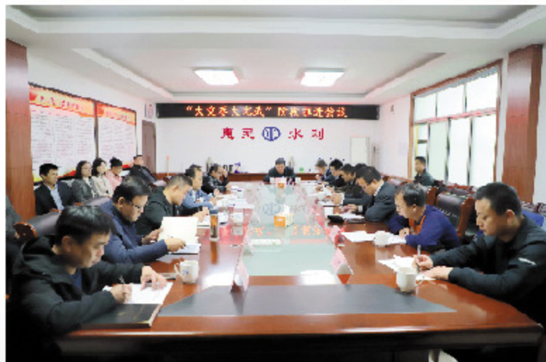
大竞赛大比武阶段推进会议