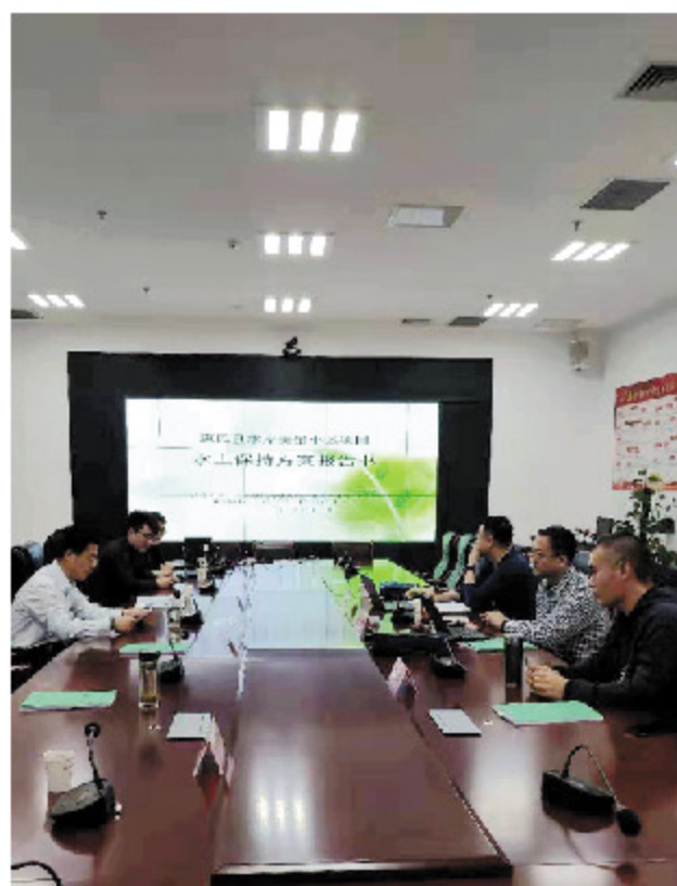
水土保持方案评审