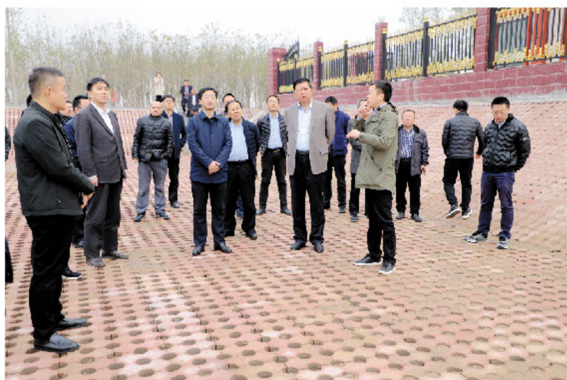
全省农村基层防汛预报预警体系现场会在我县召开

为政之要，首在治水。今年是惠民水利发展史上极不平凡的一年，主要体现在三个“特殊”。一是特殊年份，春天乃至整个上半年，我县遭遇60年一遇的特大干旱，在县委县政府的坚强领导下，县水利局抢抓引挖管黄河水，创新实施“以河代库”和“错峰引水”灌溉方式，解决石庙等黄水灌区浇地难问题，工作经验被新华网报道。汛期暴雨急转，强台风“利奇马”登陆我县，全县上下众志成城，全力迎战，实现人员无伤亡、损失降到最低的目标。二是特殊水事，今年各类水利工程总投资4.05亿元，实施了8项重点工程，其中樊桥闸、幸福闸除险加固工程是全省重点度汛后防洪减灾工程，总投资和单体投资均创历年之最。三是特殊阶段，今年是机构改革的第一年，按照《关于惠民县县级机构改革实施意见》，县水利局的渔业管理、农田水利建设项目的管理职责整合到县农业农村局，县水利局5名工作人员平稳完成人员转隶。同时，今年又是建设任务最繁重的一年，且工期紧、要求严，县水利局在人员减少、任务加重的情况下，秉持“改革不改志，善作又善成”的理念，各项工作实现新突破。